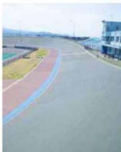
美郷町六郷自転車競技場（秋田県美郷町）