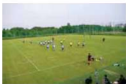
辰巳の森ラグビー場（東京都江東区）