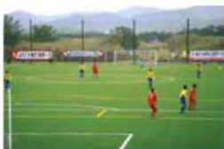
南さつま市サッカー場（鹿児島県南さつま市）