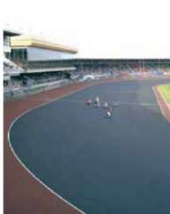
川口オートレース場（埼玉県川口市）