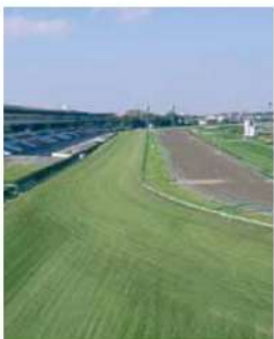
中山競馬場（千葉県船橋市）